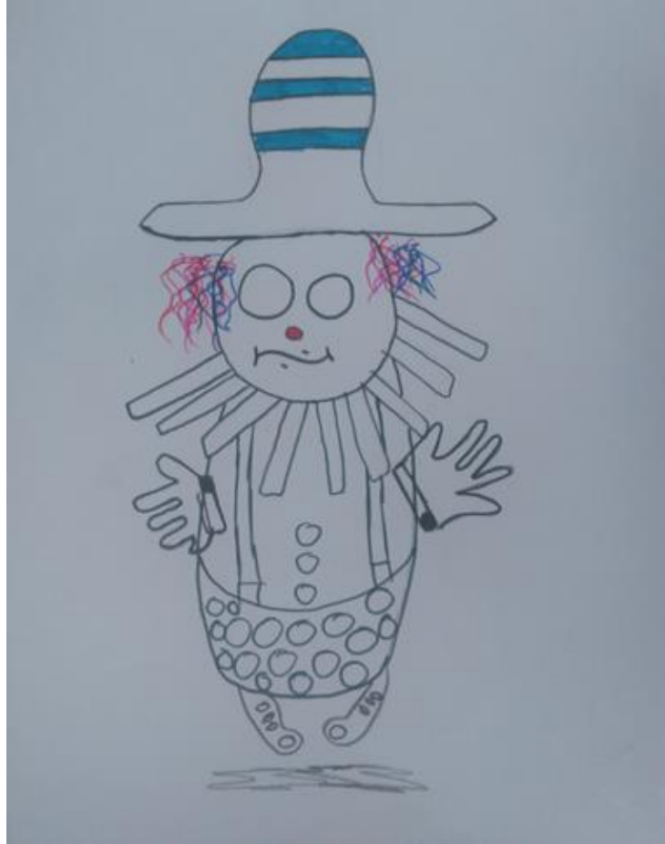
Resim 10. 12 yaşındaki erkek çocuğu

farklı bakış açıları (hem kuş bakışı hem de karşıdan bakış) kullanmıştır ve bu 4-7 yaş şema öncesi dönemde kullanılır. Mezarın çizgilerinin kalın olması duygusal bir gerilime işaretler. Mezardan çıkan iki yol biri evin biri de hastanenin yolu olabilir. Yolları ince çizgiyle ayırmıştır çünkü hala hastane ve ev arasında gidip gelmektedir. Bu sürecin en sonu için umutsuzdur ve öleceğini, bütün hayallerinin son bulacağını düşünmektedir. Sarı yarım bir güneş vardır. Bu annesiyle ilgili bir sıkıntıya işaret eder beklide annesinin güvenine çok ihtiyacı vardır veya güveni kaybetme korkusu yaşıyor olabilir. Resimde bulut yoktur. Bulut aile üyelerini anlatır, belki de artık ciddi biçimde umutsuzluğa kapılmıştır. Öleceğini düşünüyordur ve bir daha aile fertlerini göremeyeceğinden korkmaktadır, bunu da çizmeyerek belirtmek istemiş olabilir.