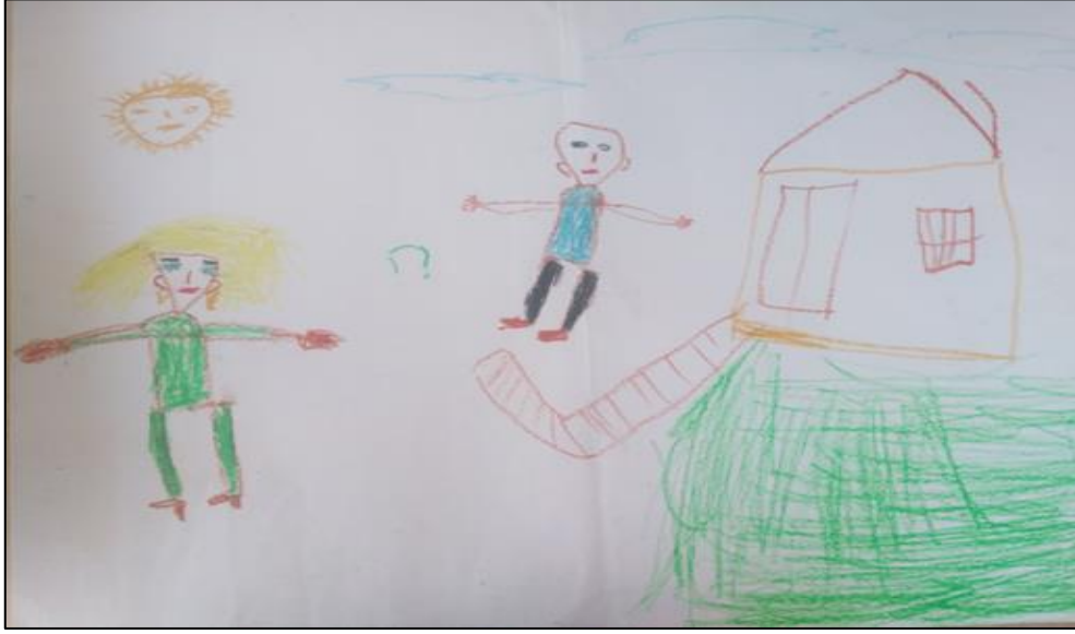
Resim 1. 7 yaşındaki kız çocuğu