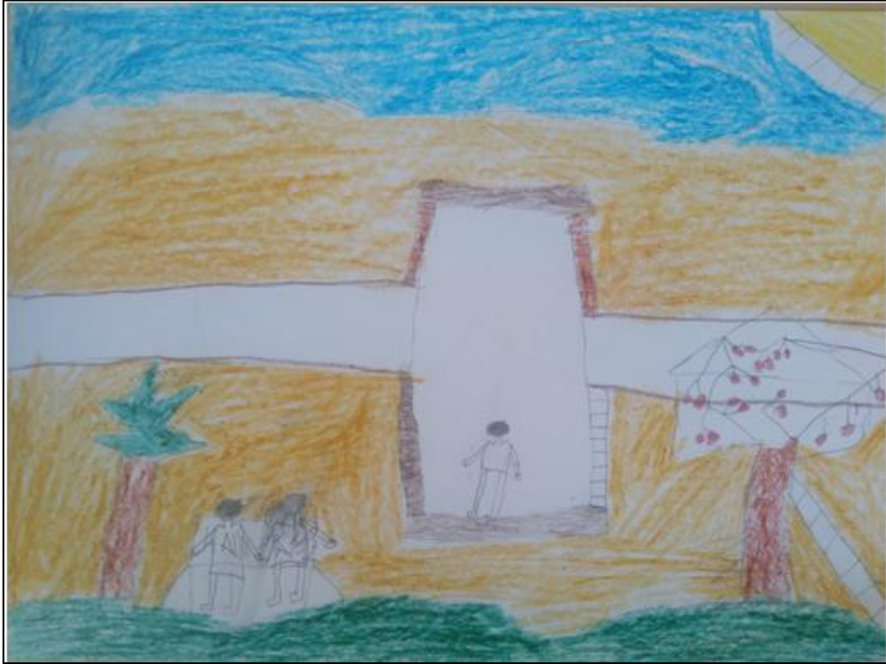
Resim 9. 12 yaşındaki erkek çocuğu

Resmin solunda çizilen kurumuş ağaç dallarından, bu hastanın en son dönemde olduğu ve bütün ümitlerinin bittiği anlaşılmaktadır. Çünkü kurumuş dallar yaşam sevincinin kaybetmiş olduğunun bir belirtisidir. Resmin sol üst kısmında bir melek figürü öbür dünya ile olan ilişkiyi; resmin sağ üst köşesinde üçgen olarak çizilen güneş figürü ailesi arasındaki ilişkilere özlem duygusunu ifade ederken resmin en üst kısmında çizilen bulutlarla bu özlem duygusu pekiştirilmiştir (Resim 8).