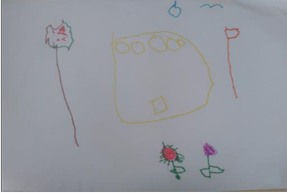
Resim 6. 7 yaşındaki erkek çocuğu