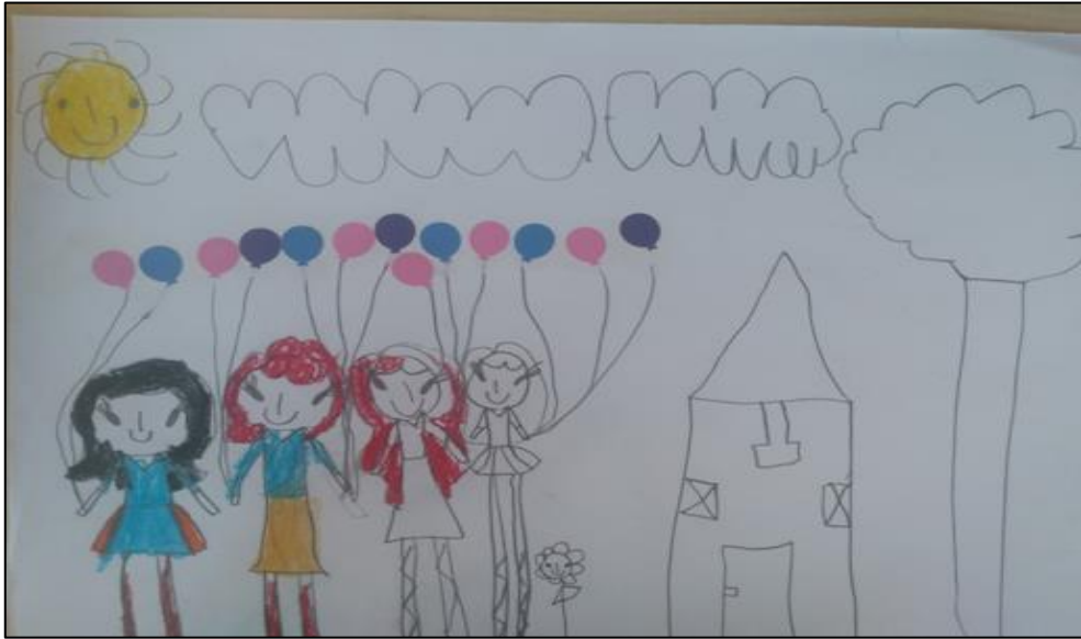
Resim 2. 8 yaşındaki kız çocuğu

bu figüründe çenesinin sivri çizilmesi, aralarındaki çatışmaları işaret etmektedir. Bu çocuk, kullandığı mavi renk ile sakin bir ruh halini siyah renkle de depresyonda olduğunu göstermektedir. Evin yanında büyük olarak çizilen erkek figüründen, kardeşinin evde egemenlik kurduğunu, tüm istediklerinin yapıldığını ve şımartıldığını anlatmak istemektedir. Resmin sol köşesinde yeşil renklerle çizilen kız figürü, aslında hastanın kendisidir. Önden çizilen bu figürde hastanın sevecen ve sosyal ilişkilerde yeterli iletişime sahip bir kişiliği olduğu anlaşılmaktadır. İki kolunun yana açılarak ve omuzların yuvarlak hatlı çizilmiş olması bu fikri desteklemektedir. Kendisini aşırı süslü resmetmesi, içindeki yaşama arzusunun bir göstergesidir. Kendisinin üzerinde çizilmiş olan güneş figürü annesinden gelecek sevgi ve ilgiye ihtiyacının olduğunu göstermektedir. Bu resimdeki bulutlar evin üstüne çökmüş olup evdeki sıkıntıyı anlatmaktadır. Ev bacasız çizilmiş olup evdeki mutsuzluğu sembolize ederken; ev pencerelerinin büyük, kalın ve demirli olması bu ailenin dışarıya karşı iletişime kapalı olduğunu göstermektedir. Evin kapısının büyük olması, başkalarına bağımlı olma ve sosyal arzusunu ön plana çıkartmayı işaret ederken; merdivenler ise çocuğun sosyal sorumluluk almaya hazır olduğunu bilgisini vermektedir. Evin önü yeşil renkte çizilmiştir aslında bu çocuğun mutluluğa özlem duyduğunun bir ifadesidir (Resim 1).