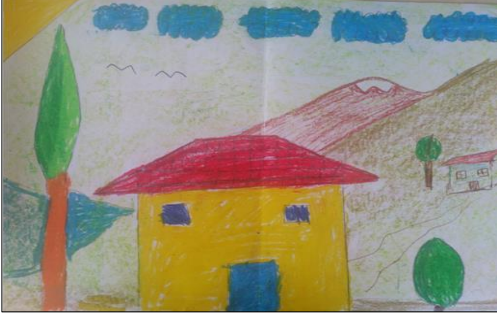
Resim 3. 9 yaşındaki kız çocuğu