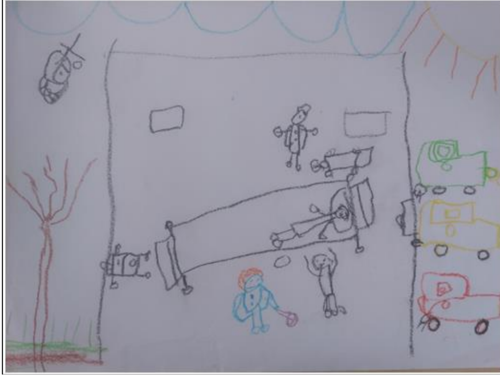
Resim 8. 10 yaşındaki erkek çocuğu

şeklinde çizilmiş alan hastane yatağını ve üzerindeki üç maviyle bastırılmış üç çizgi anne, baba ve çocuğu anlatırken bu çizgilerle, çocuktaki maviyle buluşup huzura kavuşma arzusu anlatılmak istenmektedir. Dikdörtgenin altına yazılan “dayanın” sözcüğünün altında yatan gerçek de budur (Resim 7).