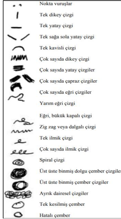
Şekil 1. 4 Yaşa Gelene Kadar Çocuklarda Görülen İlk Karalama Örnekleri

Sema öncesi dönem (4-7): Dört- yedi yaş arasını kapsayan bu dönemde artık çocuğun nesne ve renk algısı yerleşiktir. Altı yaşına gelmiş olan çocukların resimlerinde konulu çalışmalar görülürken; nesnelere gerçek rengi yerine sevilen renklerin genel olarak da parlak ve fosforlu olarak tercih edilen renklerin kullanıldığı gözlemlenmiştir (Yavuzer, 1993, s.41-48).