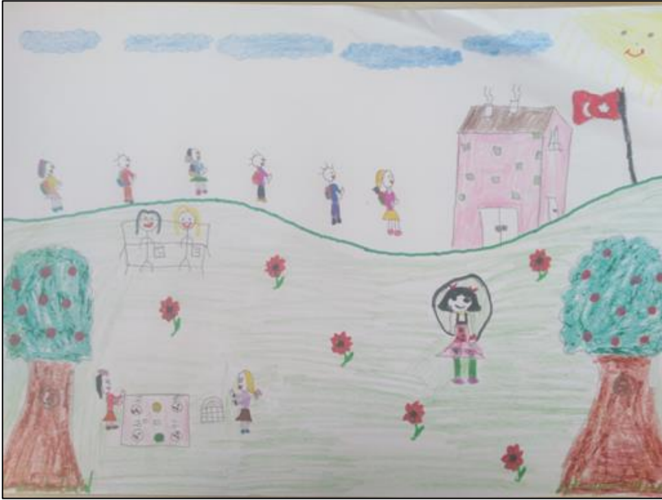
Resim 4. 10 yaşındaki kız çocuğu

birlikte güneşin sarı olması gerçek duygularını gizlediğinin bir göstergesidir. Resmin tam ortası bugünü anlatmaktadır. Çocuğun ortaya çizmiş olduğu bu resim aslında çocuğun ruh sağlığını yansıtmaktadır. Kırmızı çatılı ev mutlu bir aile demektir (bilinçaltında mutlu bir aile özlemi vardır) sarı renge boyaması da sosyal çevreye hissettiği duygularını gizlediği anlamına gelmektedir. Bu evin pencereleri mor renkte boyanmış olup, çocuğun aşırı duyarlı ve moralsiz olduğuna işaret etmektedir. Kapısı mavi renkte yapılan resimde çocuğun aslında iç dünyasında huzuru istediğinin bir göstergesidir. Bu resimde birden fazla ağaç çizilmiştir. Resimde birden fazla ağaç çizilmesi hasta çocuğun baskıdan dolayı kaygılar hissettiğinin belirtisidir. Bu ağaçlar yeşil renkte çizilmiş olup aslında bu çocuğun güven hissine ihtiyacı olduğunu ve tehlikelerden korunma arzusunun olduğunun göstergesidir. Evin arkasında dağlarla uzaklık anlatılmaya çalışılmış ve dağların arasında küçük bir ev resmi çizilmiştir. Bu iki ev arasındaki yol aslında çocuğun hastane ve ev arasındaki bağlantılarını anlatmaktadır. Resimde çizilen iki kuş figürüyle, mutluluğa, özgürlüğe ve iyileşmeye bir özlem söz konusudur (Resim 3).